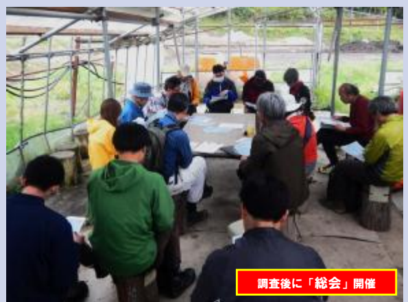
調査後に「総会」開催